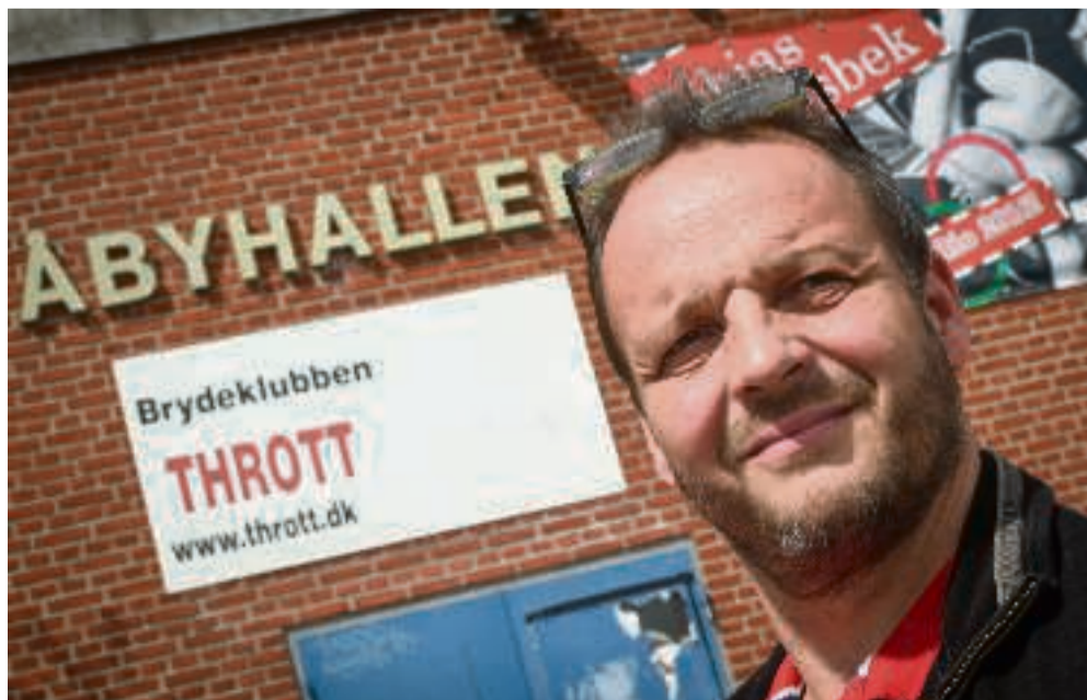
Lige nu er der 11.000 borgere om at dele Åbyhallen i Åbyhøj, hvor boliger til yderligere 6000 indbyggere er på vej. Det vil gøre presset på bydelens idrætsfaciliteter endnu større.

peger foreningen, at etableringen af en hal i størrelse - minimum 800 kvadratmeter - vil lægge beslag på mindre end fem procent af det samlede planlagte etageareal på 50.900 kvadratmeter alene for byudviklingsprojektets anden etape. Kvadratmeter som Aktiv Åby mener vil være givet godt ud med hensyn til trivsel, sundhed og integration i området.