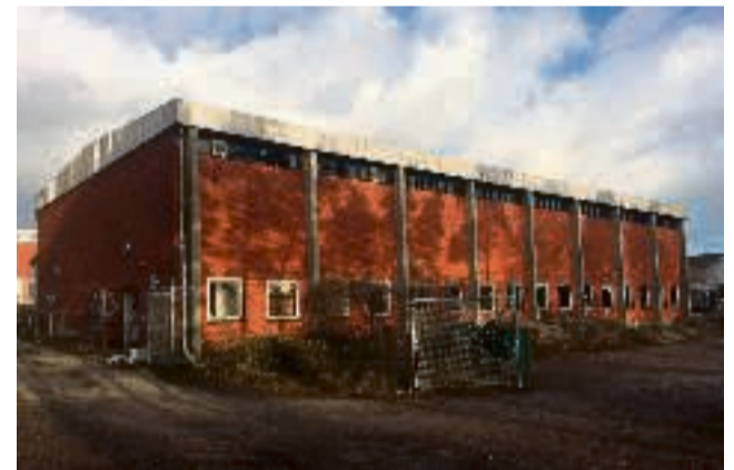
Sagens kerne. Den gamle kedelrumsbygning på Thorsvej i Åbyhøj, der i dag er i en fynsk ejendomsinvestors besiddelse.

Ejeren er en fynsk ejendomsinvestor, som Aktiv Åby gentagne gange har for søgt at få i tale omkring benyttelse af hallen, men det er endnu ikke lykket.